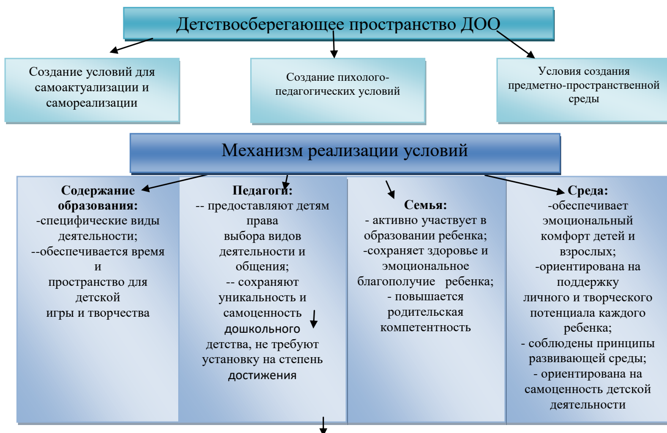
Модель детствосберегающего пространства